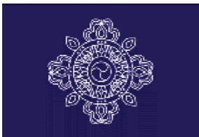
Παλιό λογότυπο AUM