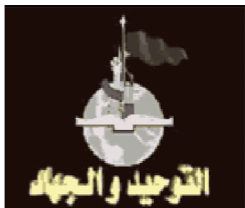
AQ στο Ιράκ